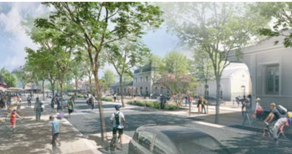
© Atelier GeorgesArchitectes & Cyrille Jacques Illustration

Au printemps, la SNCF lancera les travaux de rénovation du bâtiment voyageur de la gare d'Aurillac. L'avancée de celui-ci sur le parvis de la gare va être démolie pour laisser place à la façade du XIX e s. (cf. visuel ) et à un hall de 100 m 2 que la SNCF veut plus moderne, accessible et fonctionnel. L'information voyageurs doit également être modernisée.