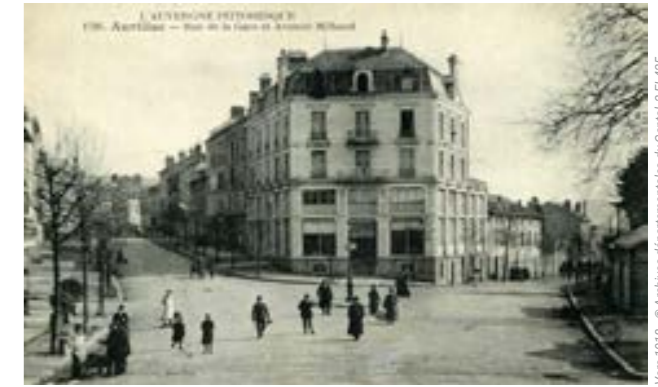
Vers 1918 - © Archives départementales du Cantal, 2 FI 425

Un autre accès à la place de la Gare, plus étroit, est possible depuis le faubourg des Carmes (actuelle rue