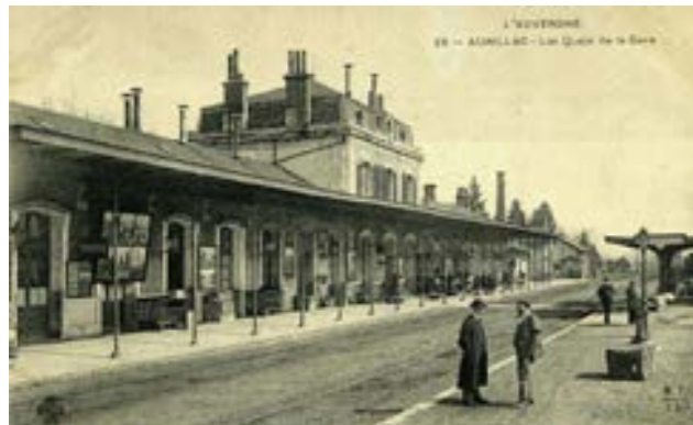
Vers 1900 - © Archives départementales du Cantal, 41 FI 907