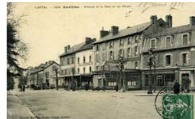
Vers 1910 - © Archives départementales du Cantal, 41 FI 896

Elle est ouverte le 26 septembre 1972 pour réduire les risques d'accidents au carrefour de Lescudilliers, favoriser l'implantation d'un marché de gros, supprimer une partie du chemin de Conthe et ouvrir une nouvelle voie entre la rue Laparra de Fieux et le boulevard extérieur.