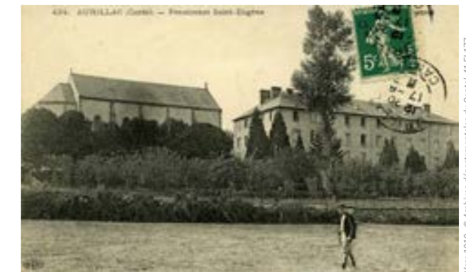
Vers 1910 - © Archives départementales du Cantal, 41 FI 177

La population prend alors l'habitude de traverser les voies ferrées pour se rendre d'un quartier à l'autre. Une habitude dangereuse : dans les années 30, il est envisagé la construction d'un mur pour l'interdire. D'autre part, la nécessité d'une passerelle se dessine. Le Conseil Municipal expose alors le projet à la Compagnie d'Orléans. Elle sera construite... en 1996 !