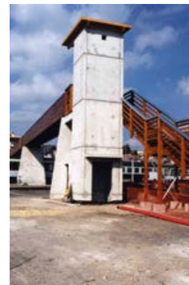
15/10/1996 - © Archives départementales du Cantal, 52 NUM 428-432

A cette époque, la gare est la zone d'attraction, départ des trains et des cars. De son côté, le quartier du Cayla s'agrandit. Ces deux quartiers comptent les usines les plus importantes de la ville et leurs personnels sont les meilleurs clients de la compagnie de chemin de fer.