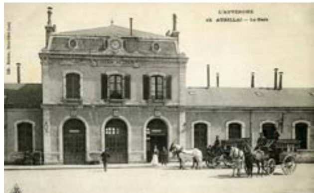
Entre 1900 et 1910 - © Archives départementales du Cantal, 2 FI 419