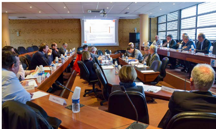
Réunion du Comité Syndical

Réponses du quizz : 2 : C - 3 : C - 4 : B - 5 : B - 6 : B