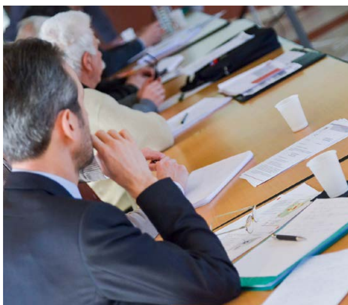
Atelier de travail

Pour répondre aux enjeux du diagnostic, le projet d'aménagement et de développements durables du SCoT est avant tout guidé par la volonté de développer l'attractivité territoriale. Le PADD est organisé autour de quatre axes qui visent tous à favoriser l'atteinte de cet objectif transversal d'attractivité territoriale.