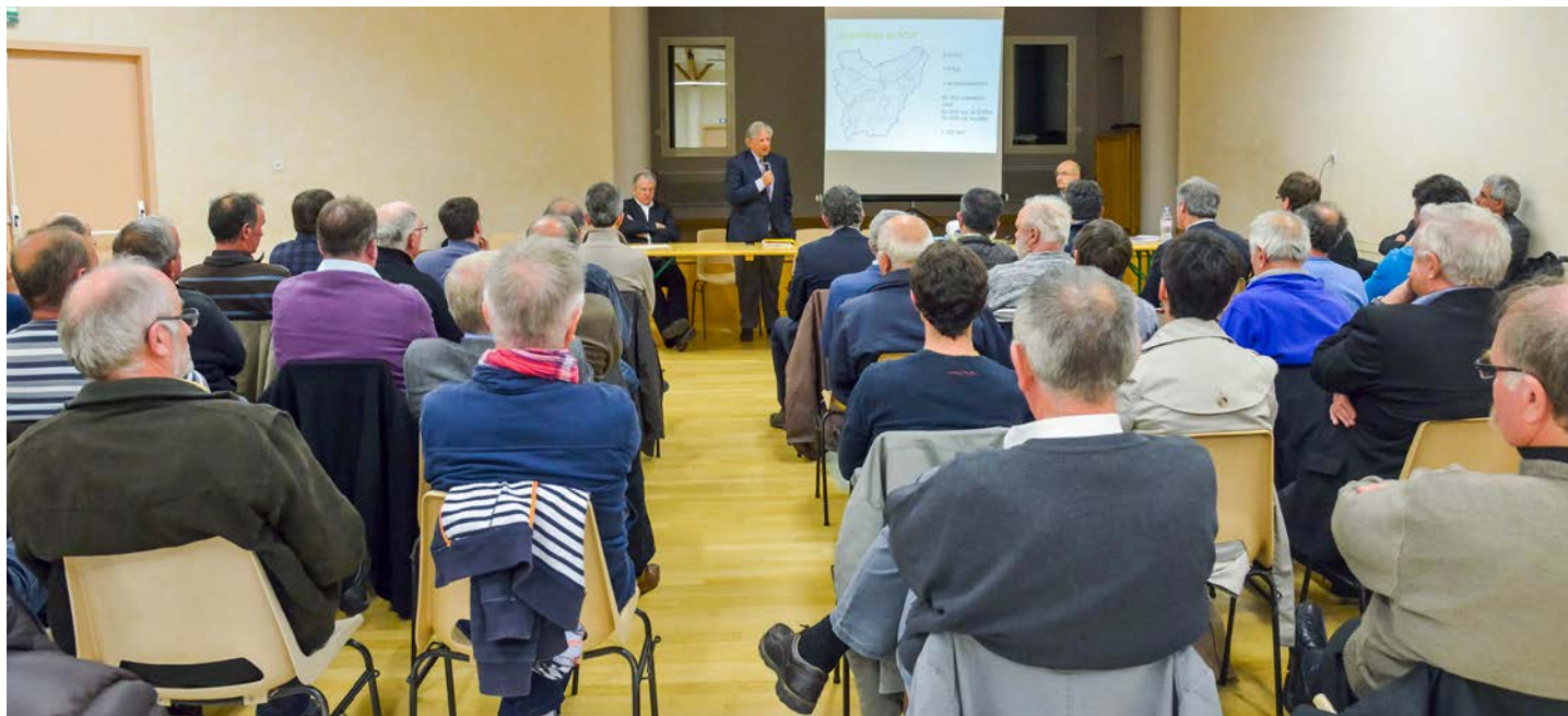
Réunion publique de présentation

Enfin, le SCoT est porteur d'objectifs de maîtrise de la consommation foncière, pour tendre vers une réduction d'environ un tiers de la consommation d'espaces naturels et agricoles. Poursuivre et dynamiser le développement du territoire en consommant moins de foncier : tel est l'objectif ambitieux recherché par le projet de SCoT.